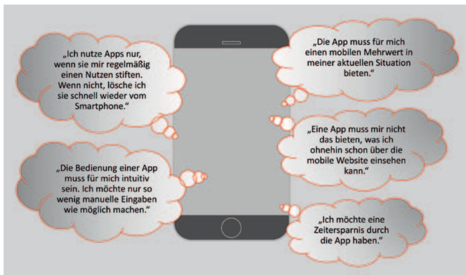
Abbildung 2: Kunden erwarten von einer App Zeitersparnis und Mehrwert .